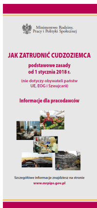
Ulotka dla pracodawców