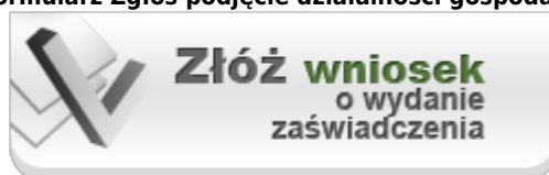
e-Formularz Złóż wniosek o wydanie zaświadczenia